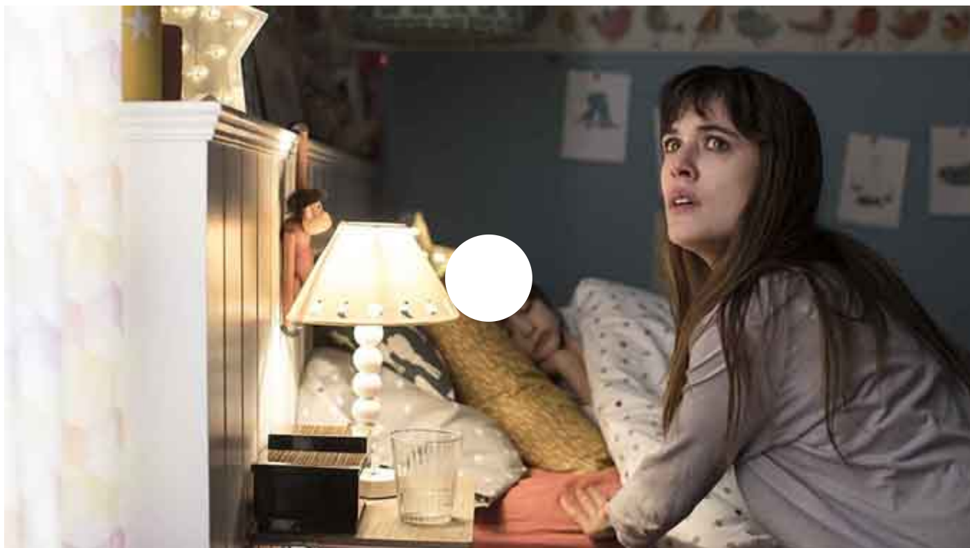
Tráiler de Durante la tormenta (2018)

“Estoy con los plomos fundidos, llevo tres semanas de promoción intensiva”, nos cuenta el propio Oriol Paulo por teléfono desde China. Allí las giras de presentación de las películas son duras y la agenda de trabajo está calculada al milímetro: 9 ciudades, 3 días de prensa en Pekín y 48 proyecciones con coloquio posterior.